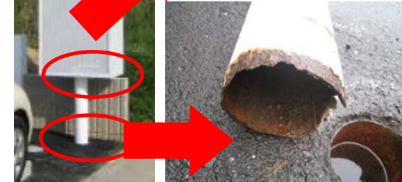
↑柱根元のサビを放置し、倒壊。

倒壊・落下の危険を見つけたら! ◆付近を立入禁止にし、見張りを置く。 ◆信頼できる屋外広告業者に連絡。 ◆人通りの多い場所では警察にも連絡。