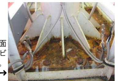
看板の根元がカバーで覆われている場合、表面はきれいでも内部でサビが進行している恐れも。