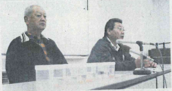
調査漁のみのスタートとなった秋漁を受け、会見する県桜えび漁業組合関係者ら(13日、静岡市清水区) (石原颯撮影)

今春、記録的な不漁となったサクラエビの駿河湾で調査漁のみのスタートとなった秋漁を受け、会見する県桜えび漁業組合関係者ら(13日、静岡市清水区) (石原颯撮影)